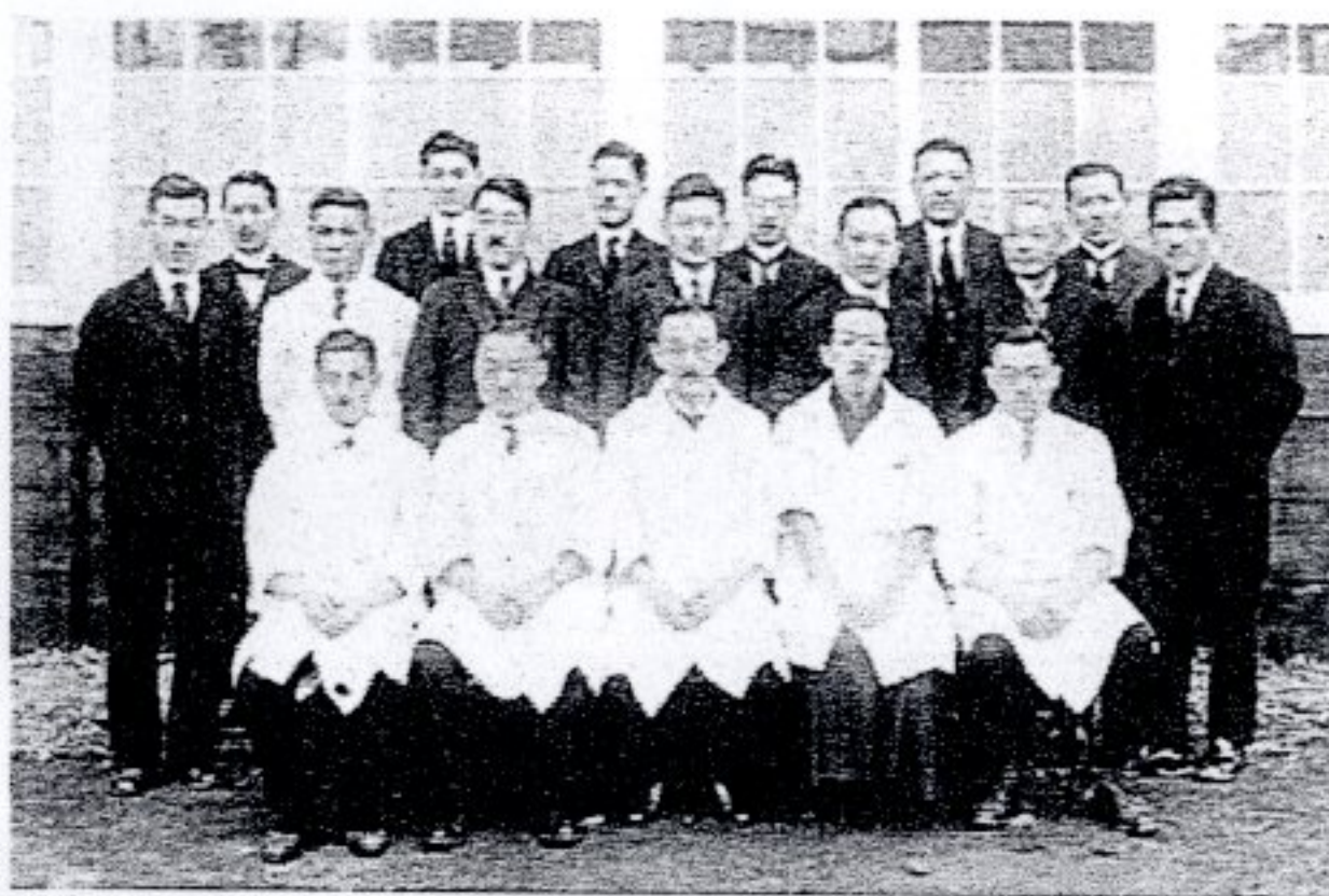
図6 医術開業試験付属病院＝永楽病院