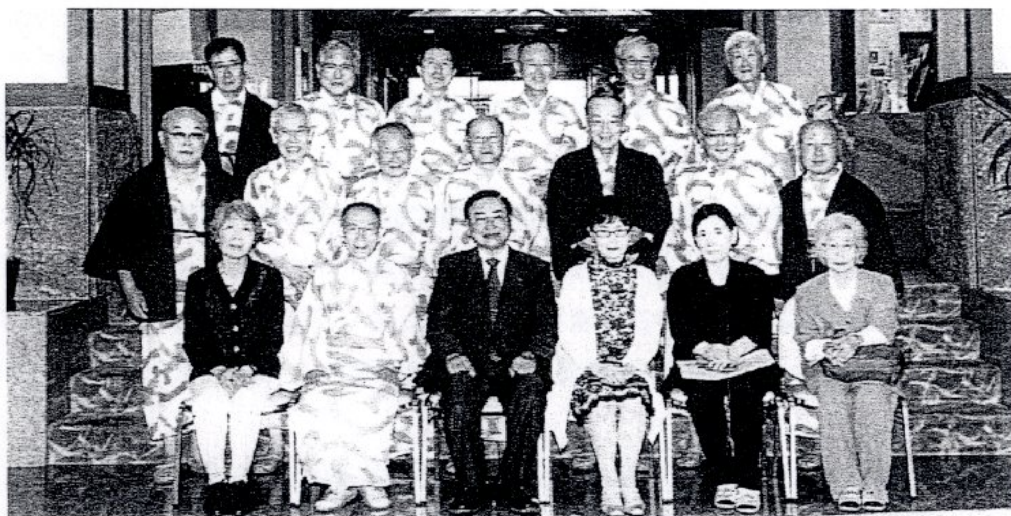
図1 東京医科歯科大学 歯科17回生同級会