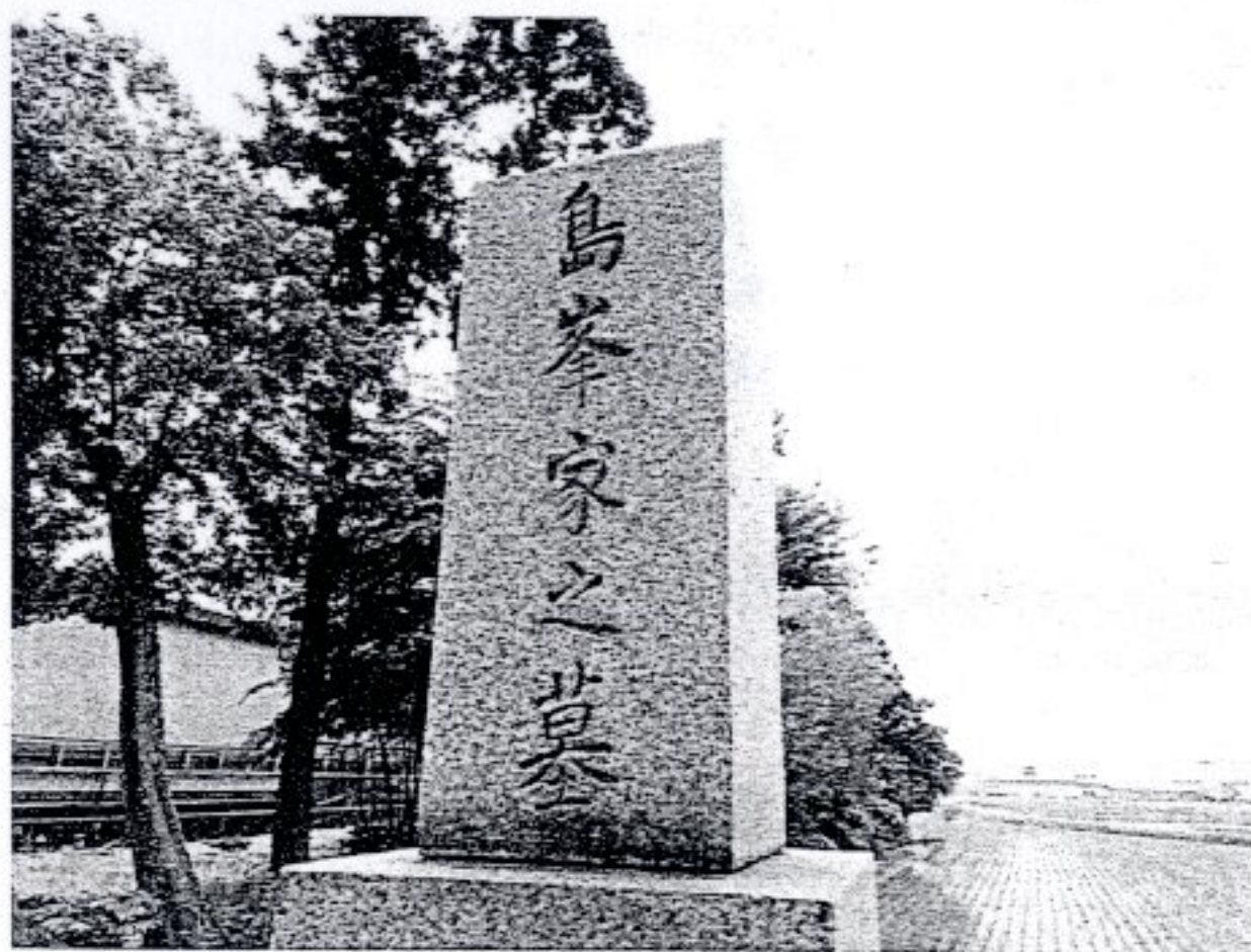
図8 島峰家及び徹の墓