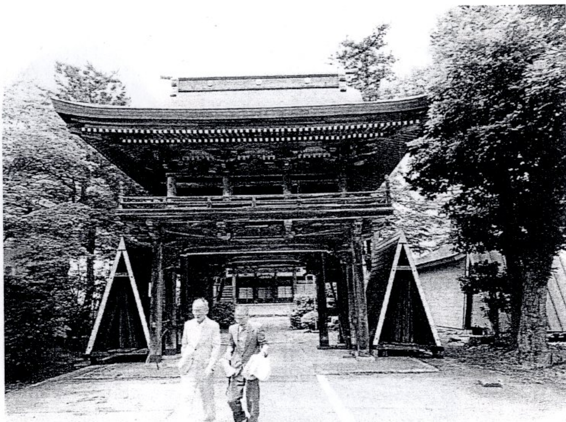
図11 島峰徹の菩提寺 妙楽寺