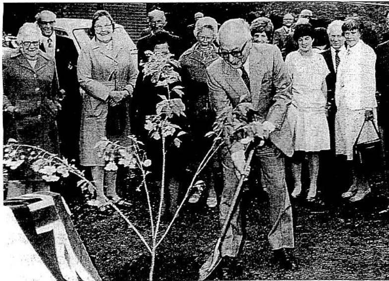
オーストラリア・タスマニアで、地元のサンデイ・ベイ高齢市民クラブの庭に友情の記念植樹