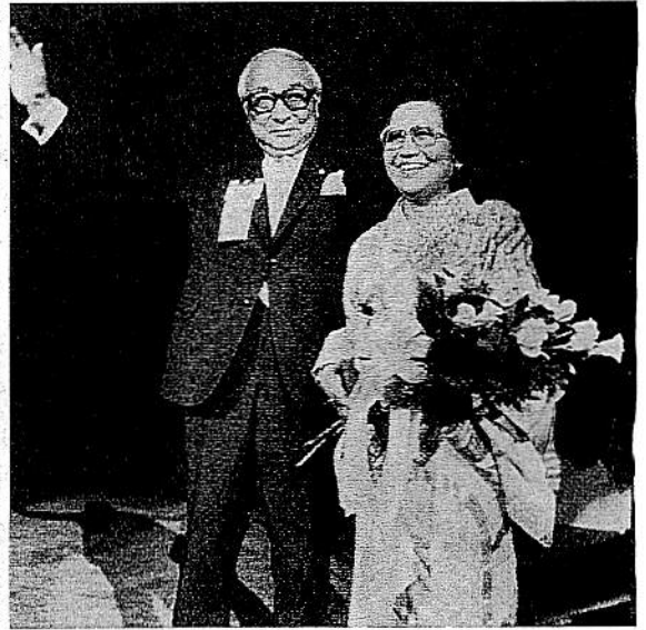
1982年6月、ダラス国際大会の最終日に壇上で紹介される向笠廣次氏と喜代子夫人

問委員、1974年、在日本ロータリー財団推進諮問委員長、1977年、RIアジア地域諮問委員、1978年にRI理事となり、そして1982年、ついにRI会長に就任されたのです。