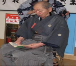
お話をされる利用者様