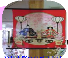
ひな人形のタペストリー

3月3日(水)、なのみ食堂にてひな祭りを行いました。昼食のちらし寿司やエビフライ等のごちそうに、おいしかったよ。わぁー、食べ過ぎたわーと、おつしやる利用者様。おやつには甘酒で乾杯!利用者様は、ひさしぶりの甘酒やさくらもちに舌鼓。皆様笑顔でとても喜ばれました。ひな祭り会では、それぞれが手作りの雛人形と一緒に「はい!チーズ」ともステキな記念写真を撮ることができました。なのみ食堂通路に展示しておりますので、是非ご覧になつてください。