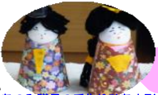
なのみ職員の手作りひな人形