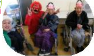
赤鬼・青鬼とナイスショット!!

2月3日(水)、利用者様ご家族様の健康と幸を願つて豆まきをしました。最初に職員より「節分の由来について説明、その後利用者様と一緒に「鬼は外」の掛け声の練習です。最初は小さな声でしたが、「大きな声でないと、鬼は現れませんよ」と司会者が言うと、段々と大きな声が出ていました。いよいよ職員扮する赤鬼・青鬼?(緑鬼)の登場。手作りのお面をかぶつた利用者様達は一斉に袋入りの豆を鬼めがけて投げつけ、1年の厄払いをしました。食堂には鬼もびつくりするほどの大きな笑いが響き渡り、最後に鬼と満面の笑顔で記念撮影する利用者様でした。癒された1日