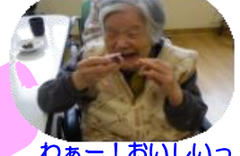
わぁー!おいしいっ