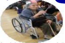
短歌を披露する利用者様