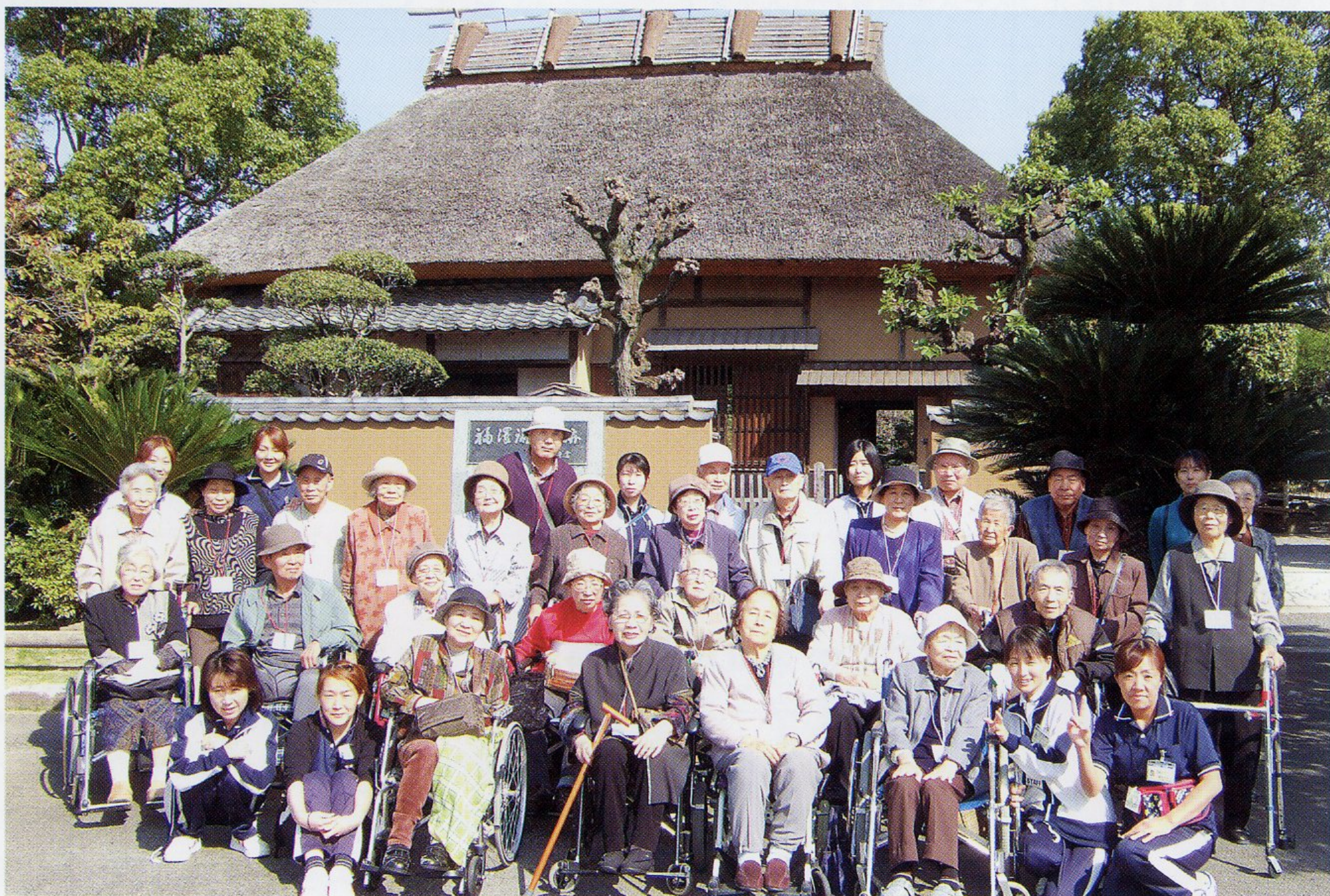
—通所リハビリ野外活動 福澤旧邸前にて—

発行／医療法人 玄真堂 介護保険事業部 広報部 大分県中津市宮夫14-1 ☎0979-24-2423