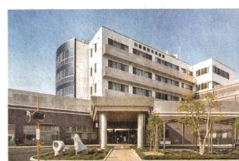
総合的な整形外科診療を実践